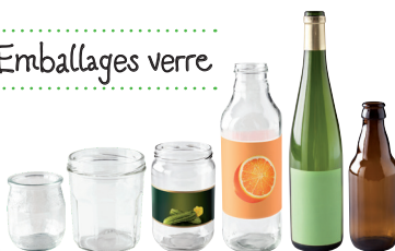
BOUTEILLES, POTS ET BOCAUX