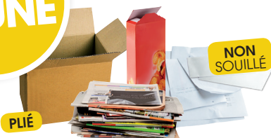
TOUS LES PAPIERS & CARTONS

Tous les papiers, cartons, briques alimentaires, emballages métalliques, bouteilles et flacons en plastique