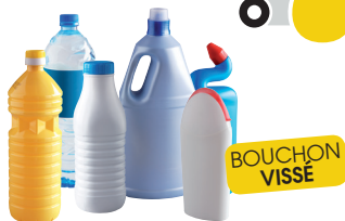
BOUTEILLES & FLACONS EN PLASTIQUE